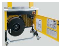
Robust, kompakt konstruktion