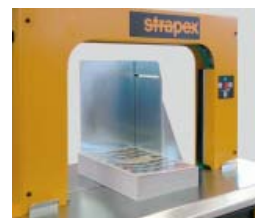
Paket-/buntanslag för riktning av lösa buntar