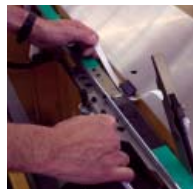
Underhåll utan verktyg